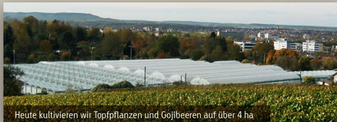
Heute kultivieren wir Topfpflanzen und Gojibeeren auf über 4 ha